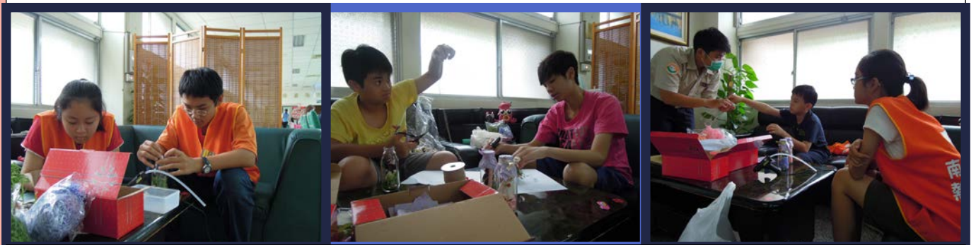
小志工們的認真與祝福都放進每一瓶瓶中信裡了