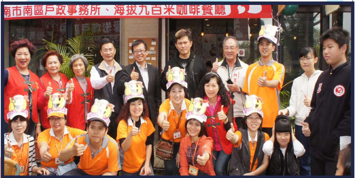
↑曼彤與姿淇協助愛心餐會↓