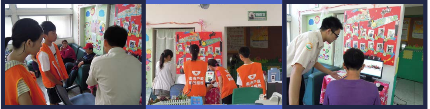
微笑之星與微笑志工