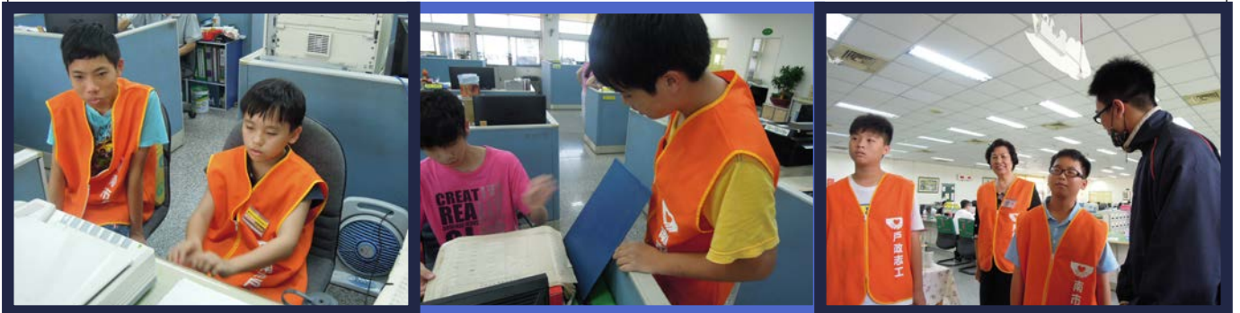
認識新同學，分享彼此服務的心得互相幫忙